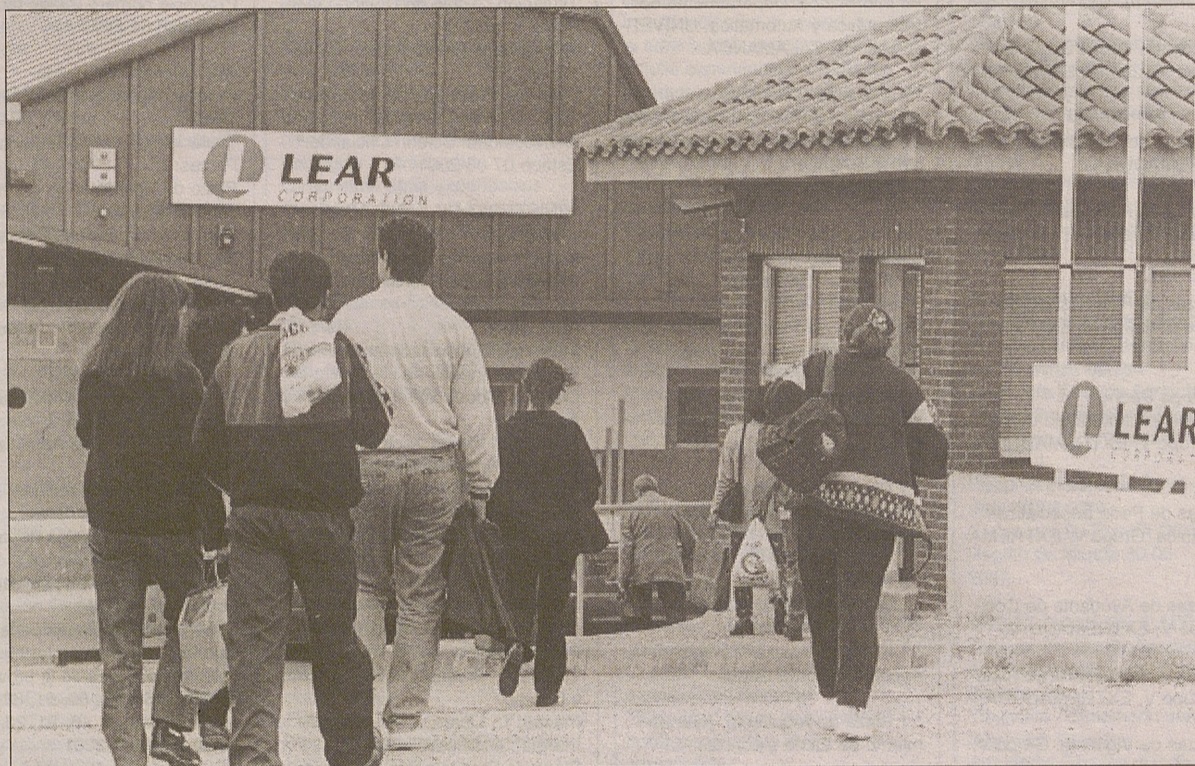
Trabajadores de la empresa Lear Corporation / Lumberas

El nuevo proyecto necesitará incrementar el número actual de trabajadores, que actualmente es de 1.500, en una cifra aún no especificada, pero que podría superar los 150 nuevos empleados. En cualquier caso, los sindicatos coin-