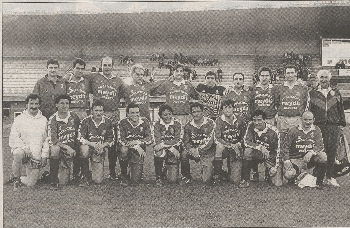
Equipo de veteranos del Real Ávila

En el descanso de este encuentro tendrá lugar la entrega de trofeos a los primeros clasificados en el campeonato de fútbol sala.