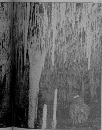
Pullolato de las Musas

... se visita. Por el año de 1831, (se lamenta) unos pescadores después de un desprendimiento de una roca, vieron un hueco y movidos por su curiosidad, se internaron y a medida de la magestad que la Naturaleza les presentaba quedaron profundamente admirados y divulgaron al pueblo tal descubrimiento. Desde entonces se han hecho muchas visitas y varias exploraciones en el subterráneo maravilloso. Muchas de ellas de gentes incomedidas, dado el mucho destrozo que en la cueva se observa. Encontramos en el «Dictionnaire,