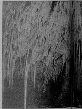
Sa Cova Pulida

espectáculo; la Naturaleza nos muestra una arquitectura fantástica y grandiosa, un laberinto de sus lagos y columnas, con sus viejas talactitas y estalacmitas. Nos vamos internando y cada vez más admirados, nos enseña nuestros inmensos salones; de algunos de sus nombres: «Sala del Dragón», «El Organo», «Sala de las Columnas», «Sala de las Banderas», «Lago Encantado», «Rincón de las Flores», «Ratonera», «Paseo de las Flores», «Comedor del Duende», «Wagner», a Gallant... La familia Encor