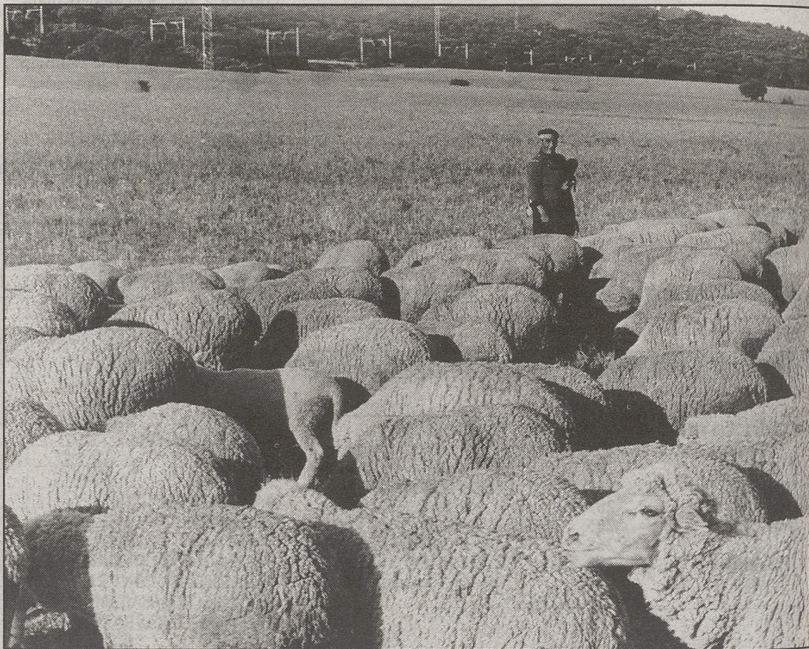
La brucelosis es una enfermedad que afecta a un 2% de las ovejas de Castilla y León

La Consejería de Medio Ambiente invertirá este año 1.600 millones de pesetas para abastecer a los pueblos de Castilla y León que presenten problemas de agua. Este dinero supone el 40 por ciento del presupuesto anual que la Consejería destina a obras de abastecimiento.