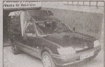
FORD COURIER 1.8 Diesel. Año 94. 50.000 km.

C/ Segovia, 24 (garaje) Telfs. (920) 22 22 33 - (908) 92 50 42 05005 AVILA