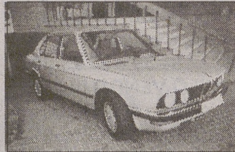
BMW 524. Turbo Diesel. Año 87. ABS. DA. Pocos kilometros