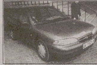
FORD MONDEO 1.8X CLX. AIRBAG, DA, CC, EE, AA. AÑO 93. 56.000 km.