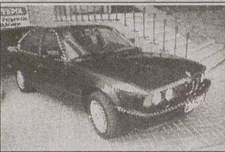
BMW 520 I. AÑO 88. TODOS LOS EXTRAS.