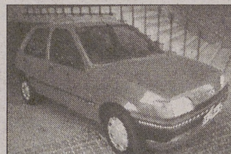
FORD FIESTA 1.3 CLX. 5 PUERTAS. AÑO 92. 50.000 kms.