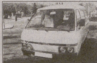
NISSAN VANETTE. Diesel. 2 plazas. 80.000 kms.