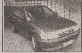
FORD ESCORT 1.8 CLX DIESEL, CC RC EE. AÑO 92