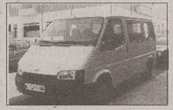
FORD TRANSIT MIXTA. AÑO 92. PERFECTO ESTADO.