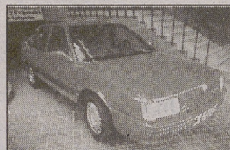
RENAULT 21 TXE. AA, DA, CC, EE. Pocos kms.