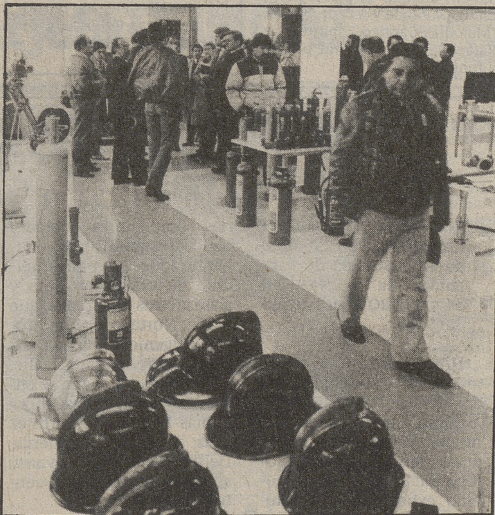
El Centro de Investigación del Fuego, de ITSEMAP, visitado por los bomberos iberoamericanos.

El Congreso Iberoamericano de Bomberos finaliza hoy en la capital de España, con una exhibición a cargo de bomberos madrileños.