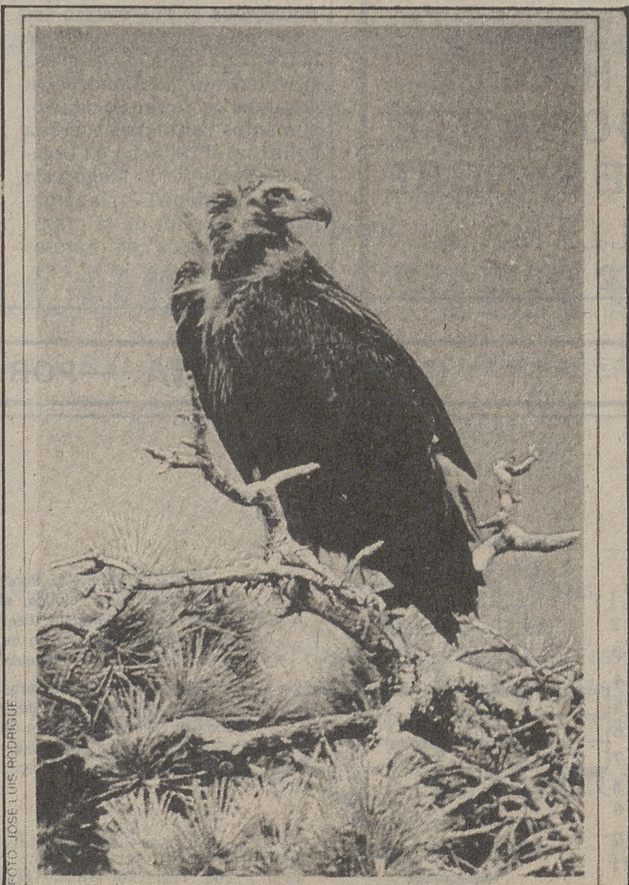
El buitre negro, en portada de un folleto editado por ADECAB.

Para terminar, la Asociación agradecer la ayuda prestada por distintas personas, que bien mediante su colaboración económica, su apoyo moral, sus sugerencias, etc., hacen posible el que este proyecto forme parte importante de la Asociación.