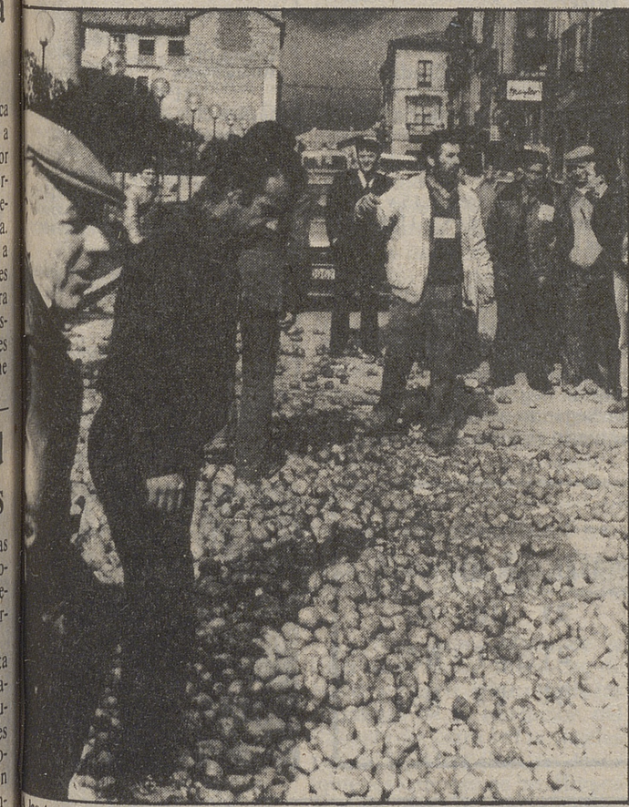
A las tres de la tarde, los manifestantes de UAGA "sembraron" de patatas en la calle de San Segundo