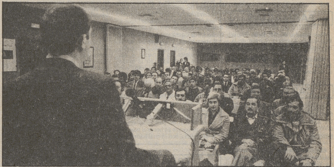
Profesionales de dieciséis países iberoamericanos, en el Congreso Iberoamericano de Bomberos