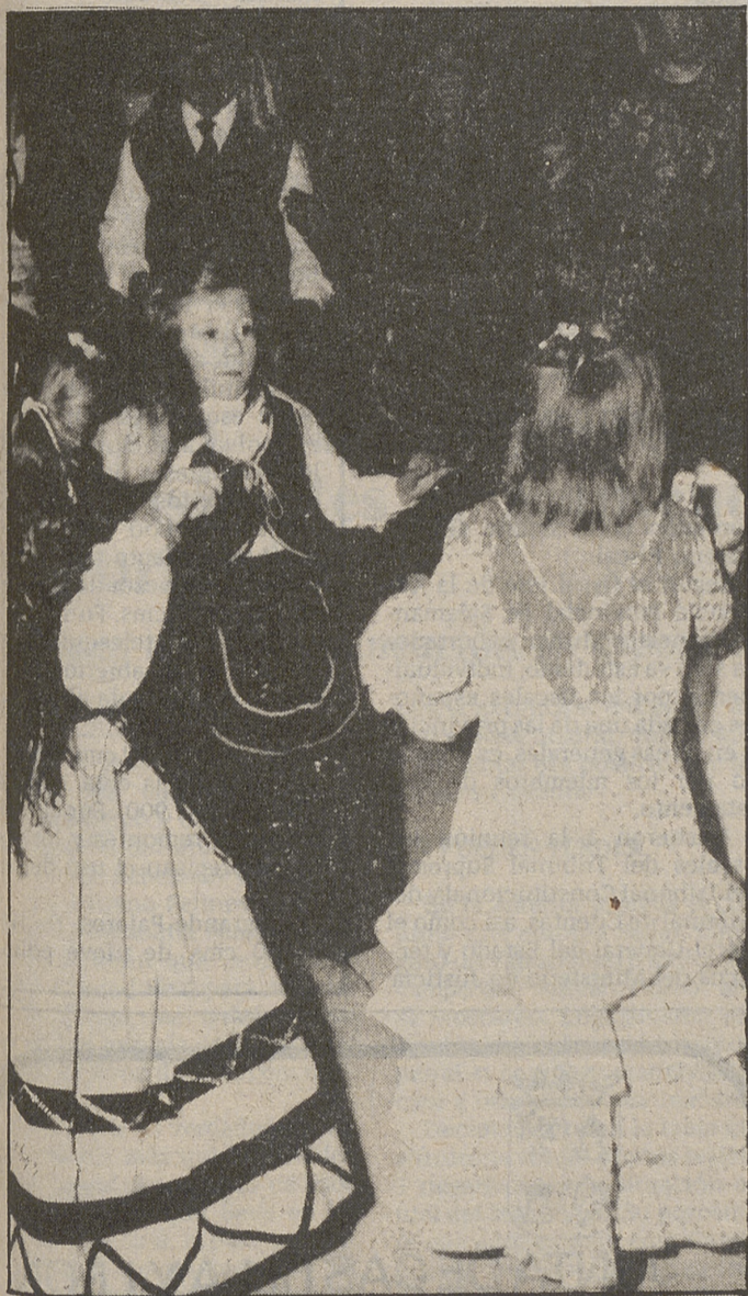
Los disfraces y trajes típicos infantiles llamaron la atención ISAIAS

No sabemos si las arcas del Concejo están en un momento deficitario, o es que los ediles son presa de apatías y desánimos. Lo cierto es que hogafío —como dicen los avezados de la boina— a los barraqueños les ha faltado el empujón municipal, ya que los concursos de jotas y disfraces, que otros años patrocinaba el Ayuntamiento, han brillado por su ausencia. Algunos administrados confiaban en que al final sonaría la flauta, pero ésta no mugió, y los festeros tuvieron que actuar por libre, sin programas ni distingos. Otra vez será.