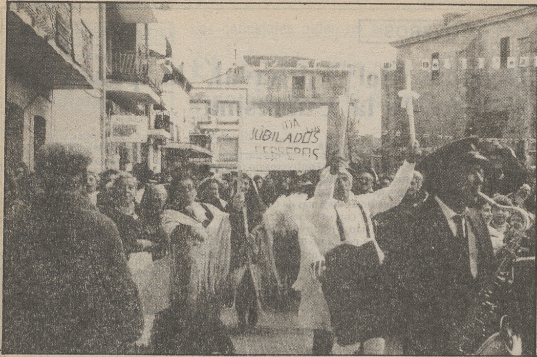
Los "recién casados" paseando, con su comitiva por el pueblo.