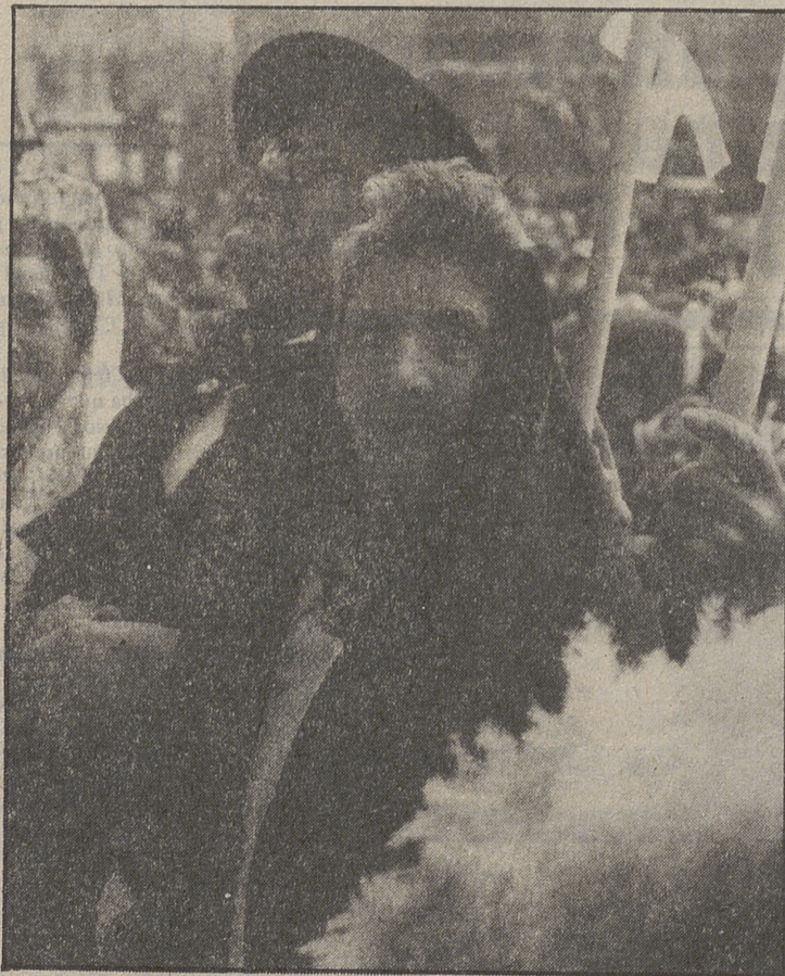
Los "novios", en el momento de "contraer matrimonio".

gozó con la compañía de nuestros paisanos y después de realizar alguna visita a los establecimientos del pueblo, partió de regreso para atender sus obligaciones.