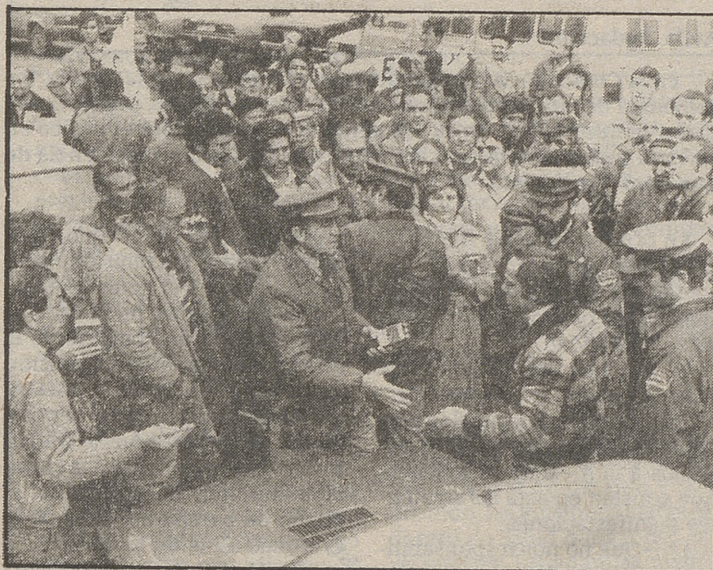
Los agricultores manifestantes demostraron no saber respetar los derechos ajenos. LUMBRERAS

La Unión de Agricultores y Ganaderos Abulenses se concentró en el Mercado Grande y se trasladó hasta la sede de la Dirección Provincial de Agricultura. Unas cien personas (380 según los convocantes) corearon