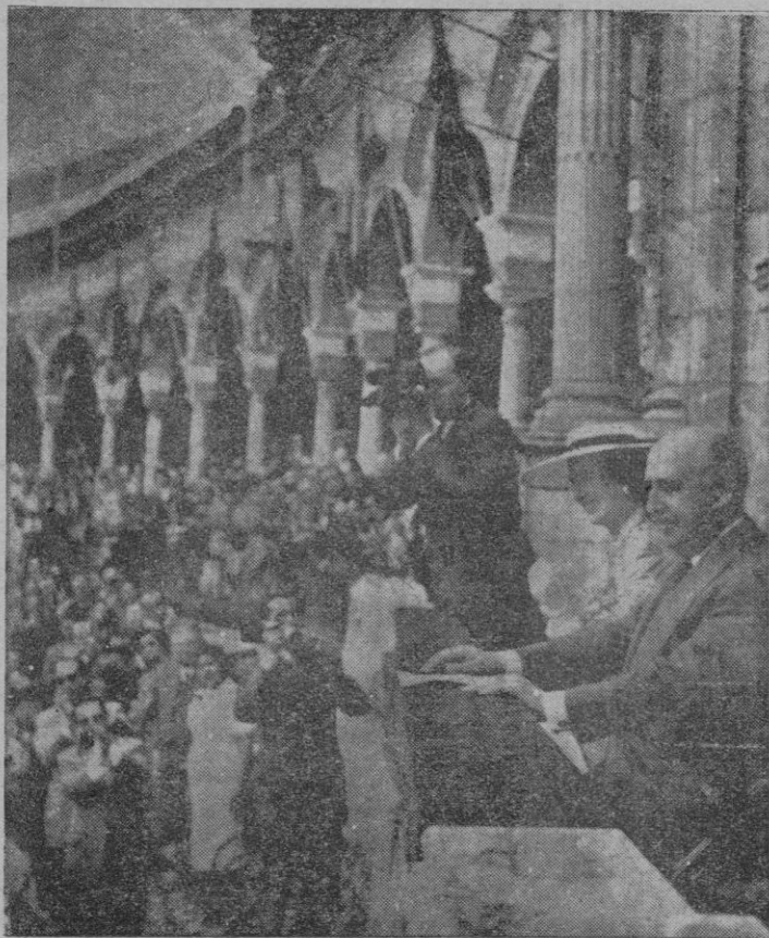
SS. EE. el Jefe del Estado y señora son objeto de las aclamaciones de la multitud al ocupar el palco desde el que asistieron a una de las corridas de Feria en «La Maestranza».