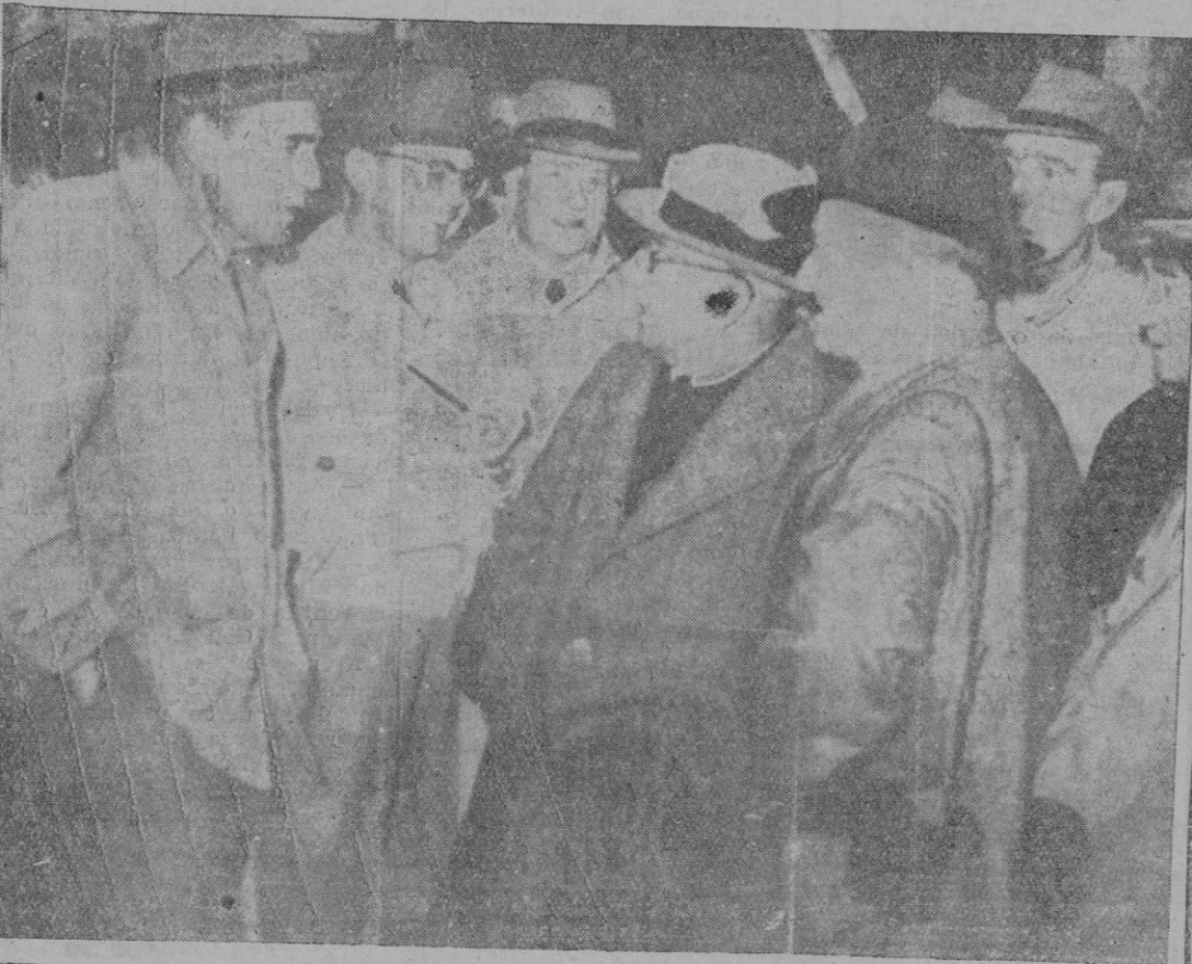
TUDELA. — El presidente del Instituto Nacional de Industria, señor Suances, junto con los ingenieros y técnicos que le acompañaron en su visita a las instalaciones de sondeos petrolíferos en Marcilla