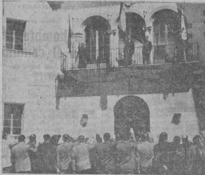
Los Maestros que asisten al cursillo de Son Serra cantan ante las banderas de España y del Movimiento el «Cara al Sol»

Alegres, con espíritu ejemplar de camaradería, salieron del aula y corrieron a formar ante el balcón central, donde seguidamente pudimos presenciar el solemne