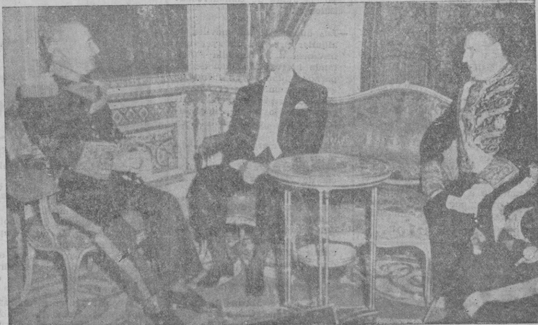
El nuevo Embajador de los EE. UU. en Madrid Mr. James C. Dunn, durante el acto de presentación de credenciales al Caudillo, en presencia del Ministro de Asuntos Exteriores, Sr. Martín Artajo