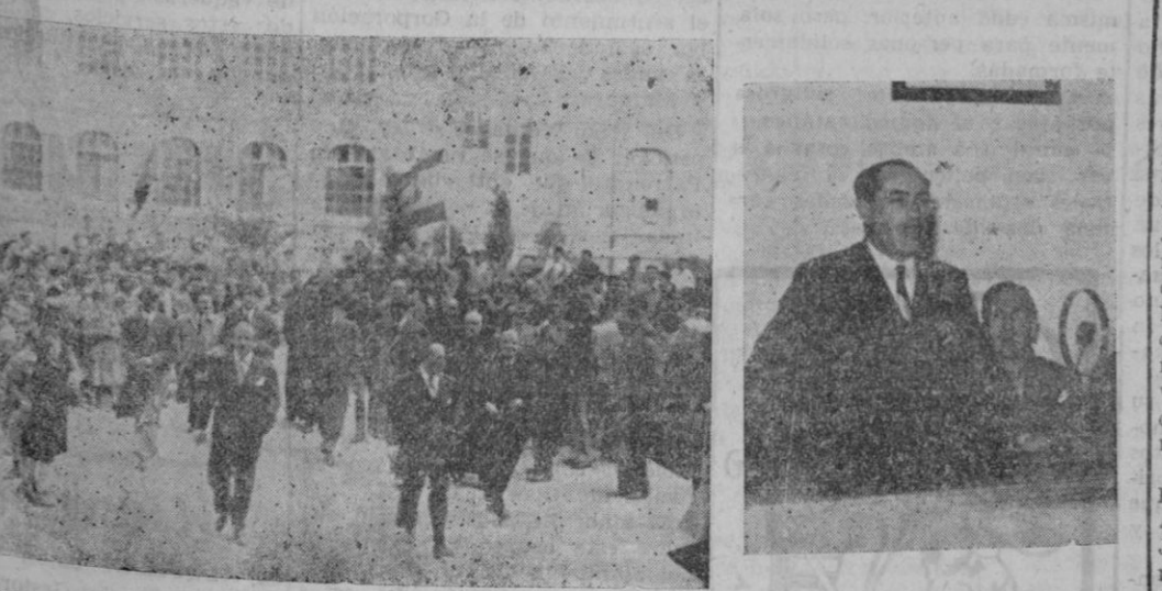
simpatía del Sr. Ruiz Jiménez, que le ganó grandes afectos y aplausos, se manifiesta en el momento que reproduce la foto con un muchacho de Felanitx. — El Ministro de Educación Nacional pronunciando elocuente discurso en el Instituto Laboral. — Un detalle de la visita del Ministro durante su discurso en Felanitx.