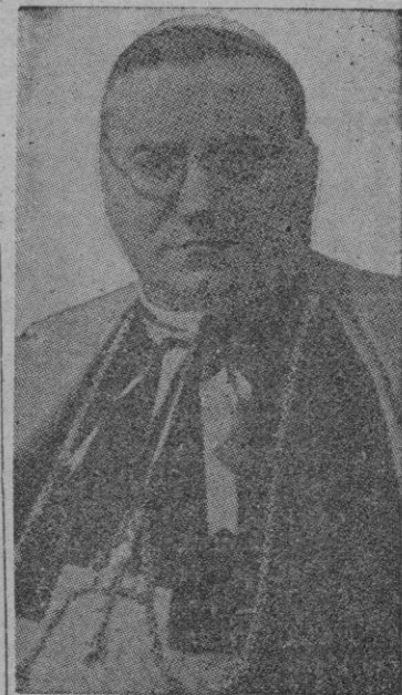
Monseñor Cicognani, Nuncio de S. S. en España que ha sido elevado al Cardenalato

capa y pasó al salón del Trono, en donde se situó a mano derecha del sitial, a ambos lados del cual se situaron el Patriarca Obispo de Madrid-Alcalá y el Vicario General Castrense. A la voz de «paso al señor Cardenal» entró en el salón Monse-