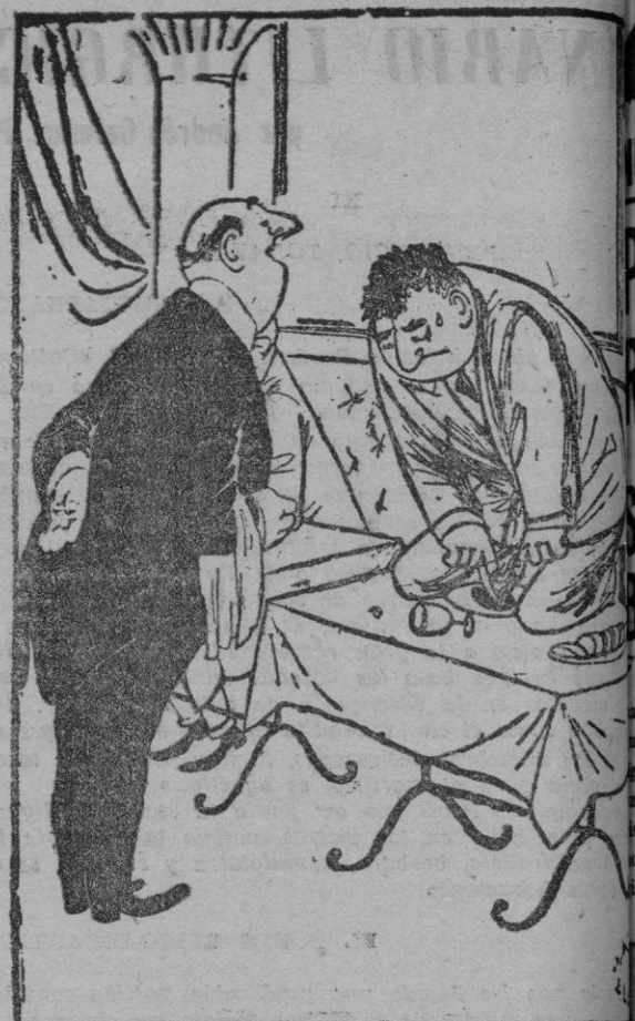
Esa prueba que la carne está muy fresca, señor.

Calculándose que cada turista norteamericano gasta un mínimo de 24 dólares diarios mientras se encuentra en Suiza, Niederer dijo que la suma gastada por los turistas de dicha nacionalidad durante el año 1952 podría calcularse en unos veintidós millones y medio de dólares.