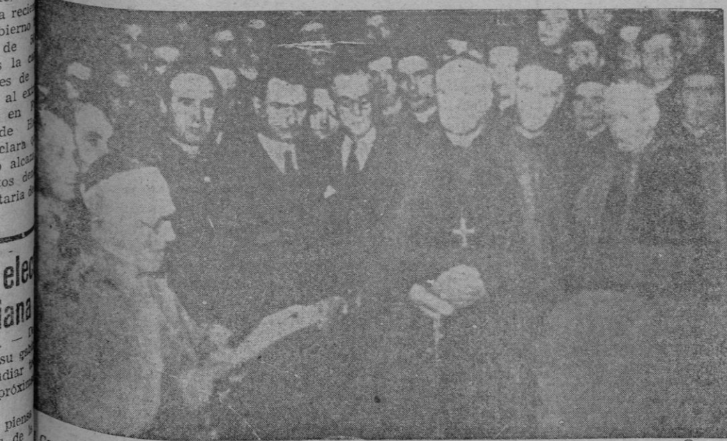
Cardenal irlandés Monseñor D'Alton lee el billete de su nombramiento ante relevantes personalidades de la Curia Vaticana