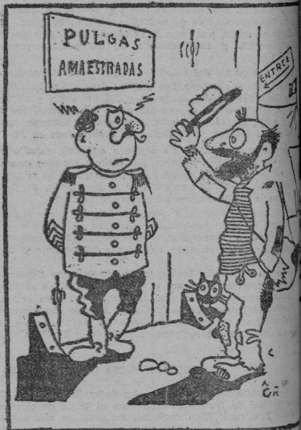
La entrada de abastecedores, ¿me hace el favor?