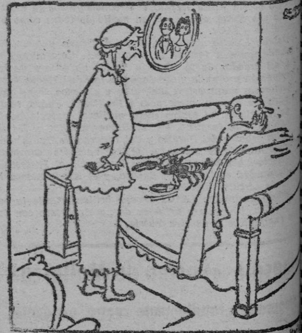
¿Me parece que ya he encontrado el sistema de que se trata?