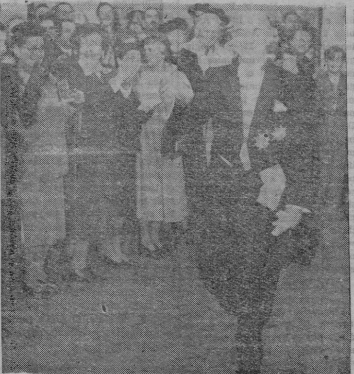
Grupo de alemanes residentes en Madrid que fueron a felicitar al Embajador de su país con ocasión de las fiestas de Navidad