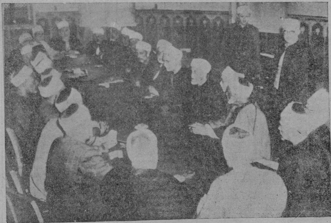
En el Cairo se ha reunido el Consejo de Ulemas, la más alta autoridad en la religión musulmana, para discutir la situación del Norte de Africa, acordando instar de los países árabes la ruptura de relaciones diplomáticas, económicas y culturales con Francia.