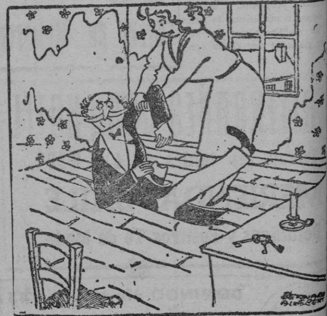
"PISO MODESTO SE TRASPASA..." — Quiere pasar a ver los dormitorios?