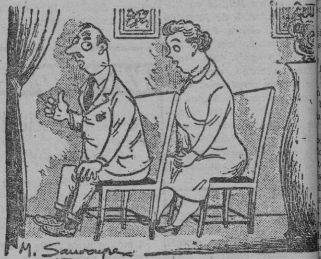
—Esto de que los nuevos vecinos sean extranjeros es un fastidio; No se entera uno de nada de lo que hablan!