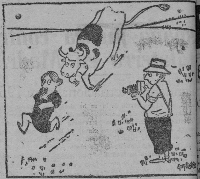
—No hagas demasiado esfuerzo, Julia; vas a salir muy natural. (De "Ici Paris".)

El próximo lunes, a las 7 de la tarde en la Sala Medina habrá una audición en discos, por sistema «Long Playing Record» de la Sinfonía Patética de Tchaikowsky así como también de la famosa Misa Solemne de Beethoven. Habiendo sido impresionada la primera por la Orquesta de New York y la segunda por una selección de elementos alemanes.