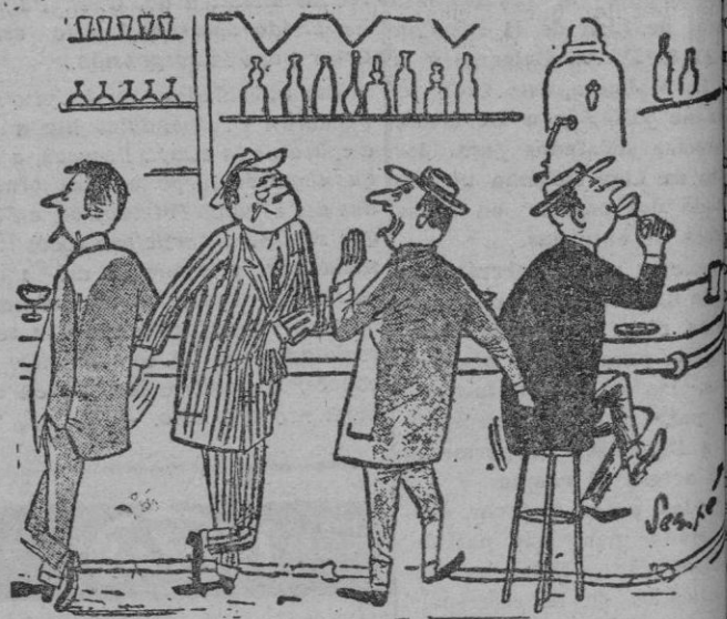
—De ningún modo, querido amigo; Ahora tengo yo mucho gusto en convidarle!