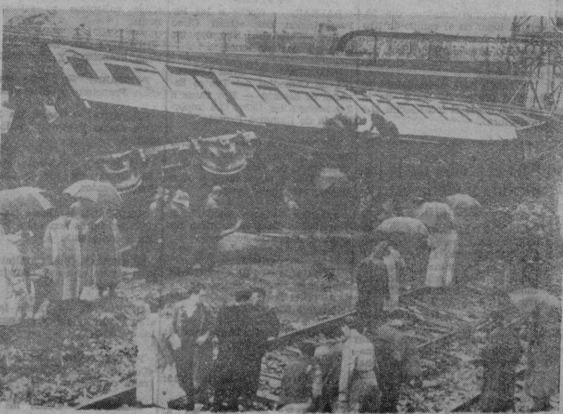
Estado en que quedó el coche de viajeros de la línea Bilbao — Portugalete que descarriló y volcó, no cayendo a la ría por im pedirlo unas excavadoras que fu ncionaban en la orilla