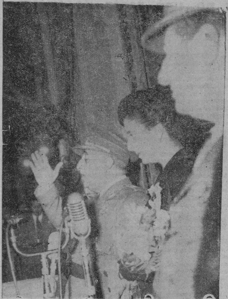
El Jefe del Estado, acompañado de su esposa, ministros del Gobierno y otras personalidades dirigiendo la palabra a la multitud que le aclamaba.