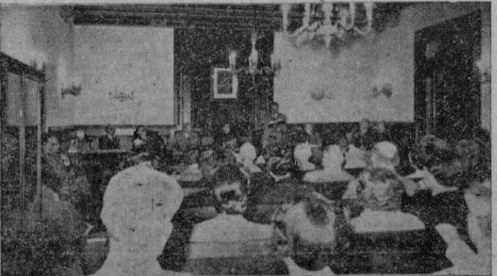
Aspecto que ofrecía la Sala de Actos, durante la conmemoración del cincuentenario del poeta don Jacinto Verdaguer.