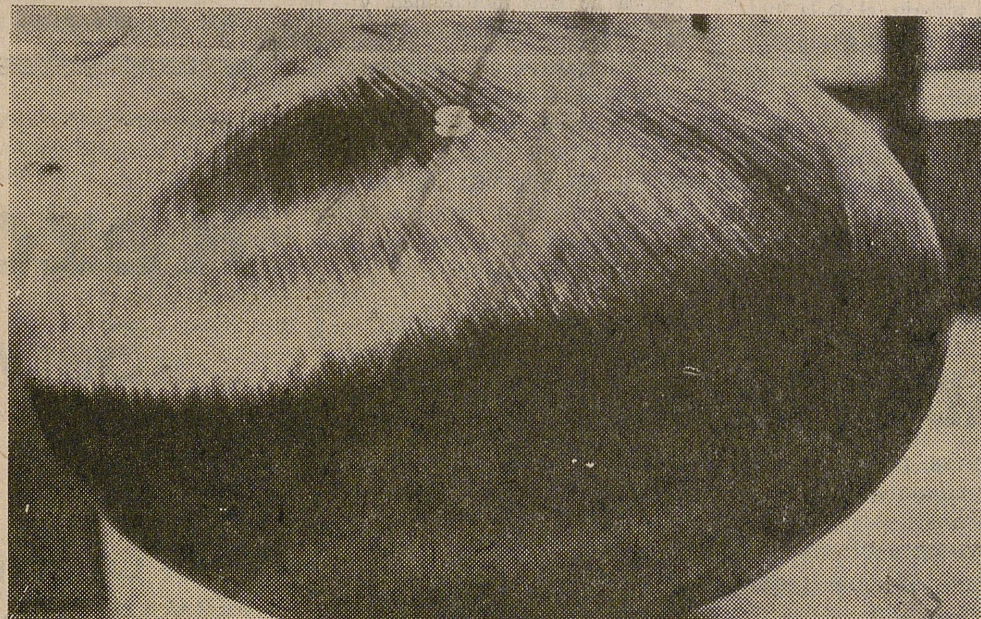
BRUNNSWICK (DaD).—El objeto de la fotografía no es una obra de arte ni tampoco una fruta descomunal. Se trata de un depósito de combustible de fibra de carbón y construido en unos laboratorios de Brunswick (República Federal de Alemania). Será instalado en la plataforma de impulsión del laboratorio espacial «Spacelab». Por su dureza, consistencia y escaso tamaño resulta más ventajoso que un depósito de aluminio, y ha sido calificado por los científicos de «cuerpo casi ideal».—(Foto: DaD/ALBRECHT).