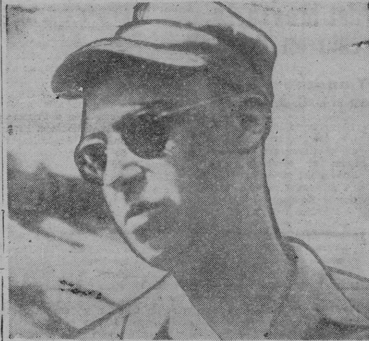
Una de las últimas fotografías del desventurado explorador francés Marcel Loubens, miembro de la expedición que pretendía descender a la famosa caverna de Pierre Saint Martín, en la misma raya fronteriza hispano-francesa

La bajada se efectuó con material moderno: escaleras de «duraluminio» de doble trizado con hilos de acero de 3 mm de espesor, electricidad acoplada al casco — focos — con pilas en la cintura, monos cerrados imper-