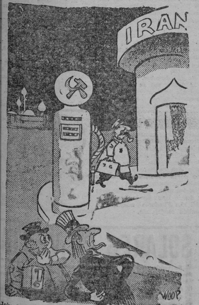
John Bull y el Tío Sam: No se puede tolerar que Stalin se instale aquí

WASHINGTON, 10 (Efe). — De fuente bien informada se dice que los aliados occidentales han resuelto sus diferencias con el régimen comunista de Tito y que pronto le concederán 93 millones de dólares en un nuevo programa de ayuda económica y militar.