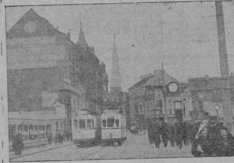
Una calle de Saarbrücken capital del Sarre

de los países que han formado la Comunidad Europea del Carbón y del Acero —plan Schuman—.