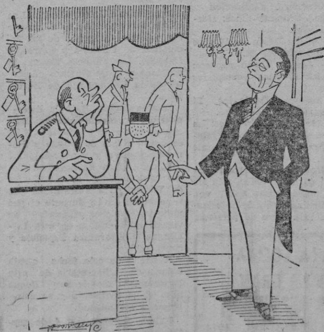
—Desengañese, el único que podría solucionar el problema hotelero es el ex-rey Faruk.