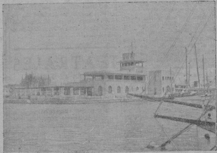
Club Náutico y Catedral al fondo

De cómo se cambió el más co- espuma en el nacimiento del chambroso lugar de la ciudad Club. Después... todos lo hemos en su encontrada de más pres- vivido. Una afición que despiert