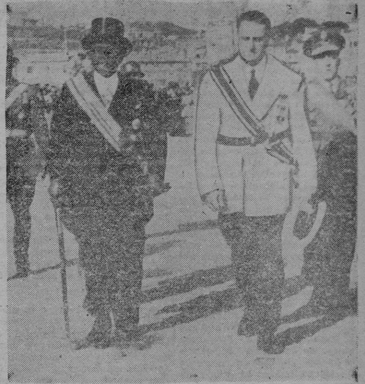
A su llegada a La Coruña, el presidente de Liberia pasa revista en compañía del Ministro de Asuntos Exteriores a las fuerzas que le rindieron honores