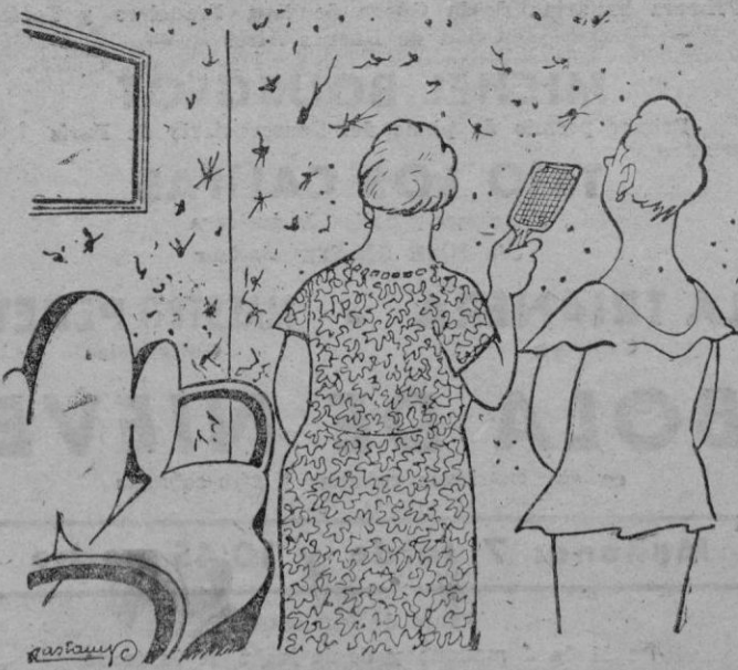
—¿Qué decoración tan moderna y original! —Si; son mosquitos aplastados en la pared.