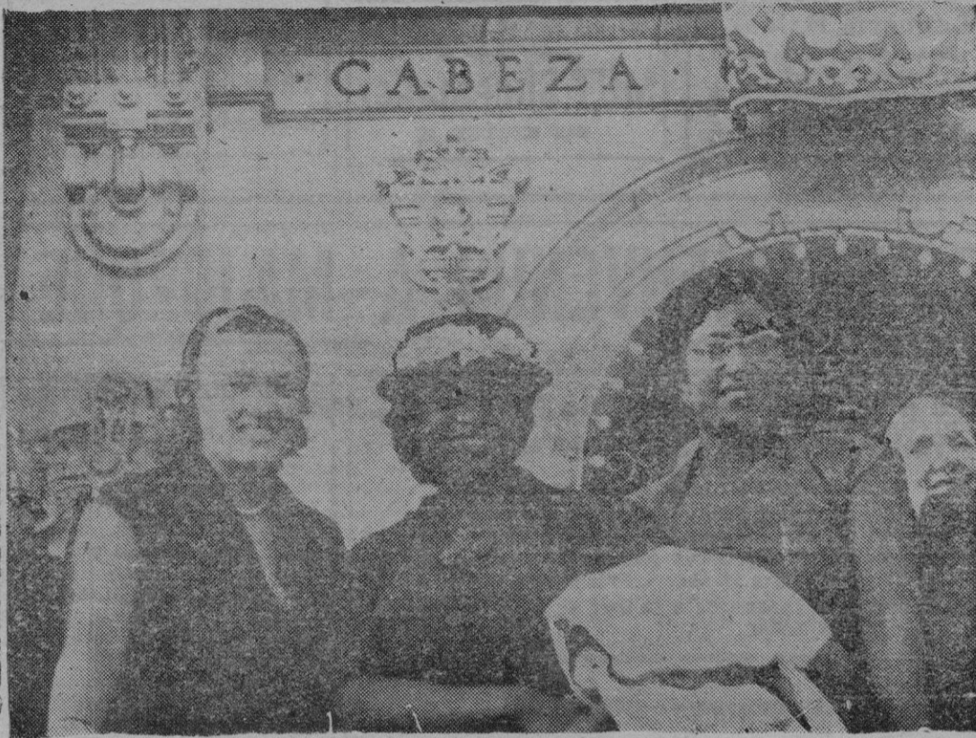
La esposa del presidente de Liberia, acompañada de la del Gobernador Civil de La Coruña y una dama de su séquito, presenciando el desfile de tropas a la llegada de aquéllos a La Coruña

tecimientos de otras partes del mundo. Pero la actualidad de Liberia es pacífica e invitadora aunque esté rodeada del misterio que la espesa jungla africana pone a sus lejanos y exóticos contornos.