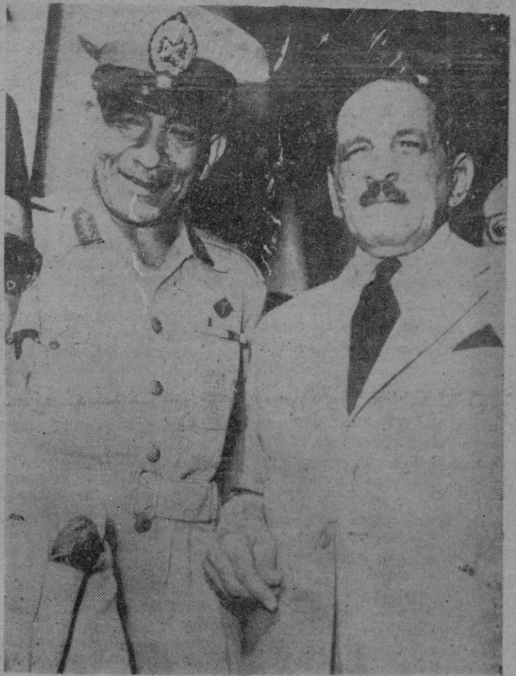
El general Nagib Bey se entre vista con el primer ministro Ali Maher Pasha, después de hacerse pública la abdicación del rey, Faruk.