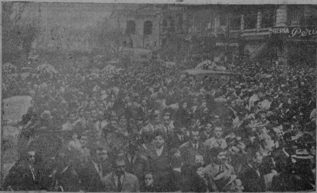
Un gentío inmenso, que se calcula en medio millón de personas, se dirige al Ministerio de Trabajo y Previsión para rendir su postrer tributo a la insigne mujer desaparecida.

Señalar además que en Alemania Occidental deben ser atendidos todavía tres millo-