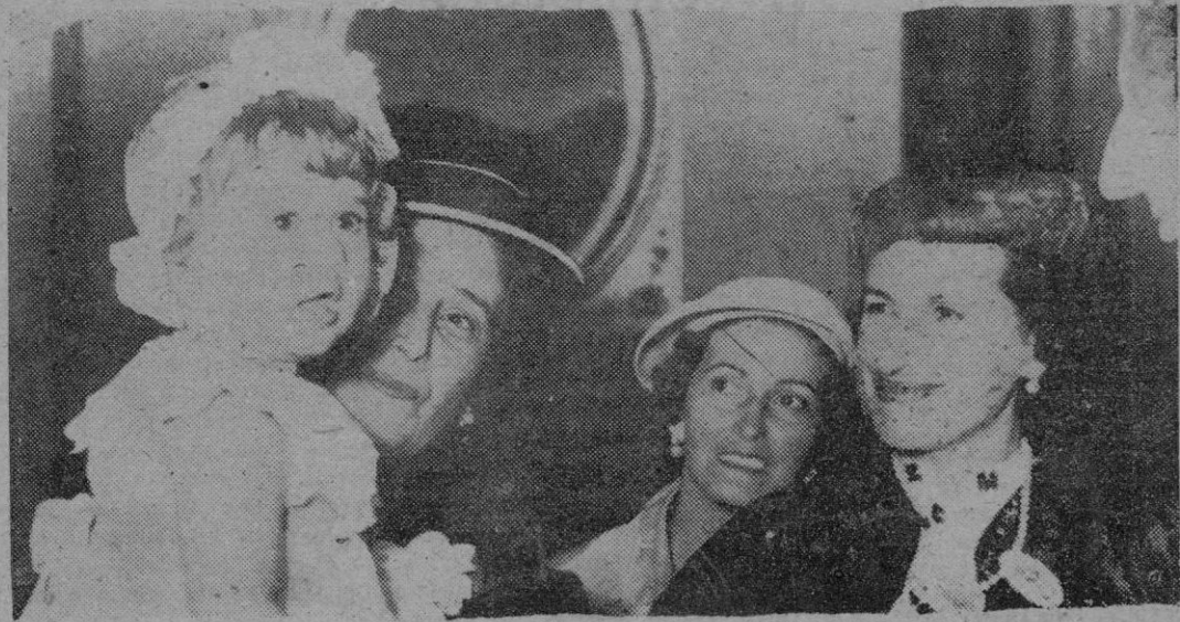
Doña Carmen Polo de Franco a la llegada a San Sebastián, llevando en brazos a su nietecita, la primogénita de los marqueses de Villaverde.