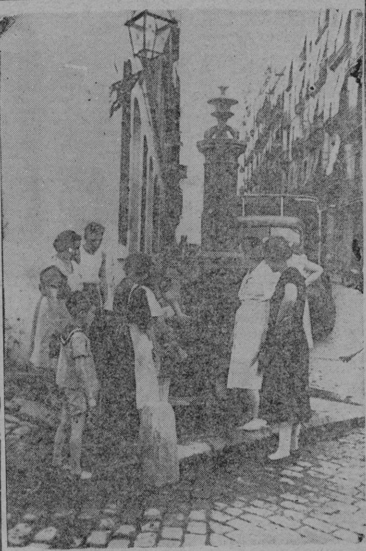
La ola de calor que azota Europa se deja sentir en Barcelona. El hielo escasea, las mujeres se acercan a las fuentes para llenar sus cántaros de agua fresca que servirá para calmar la sed y hacer más llevadero el calor.