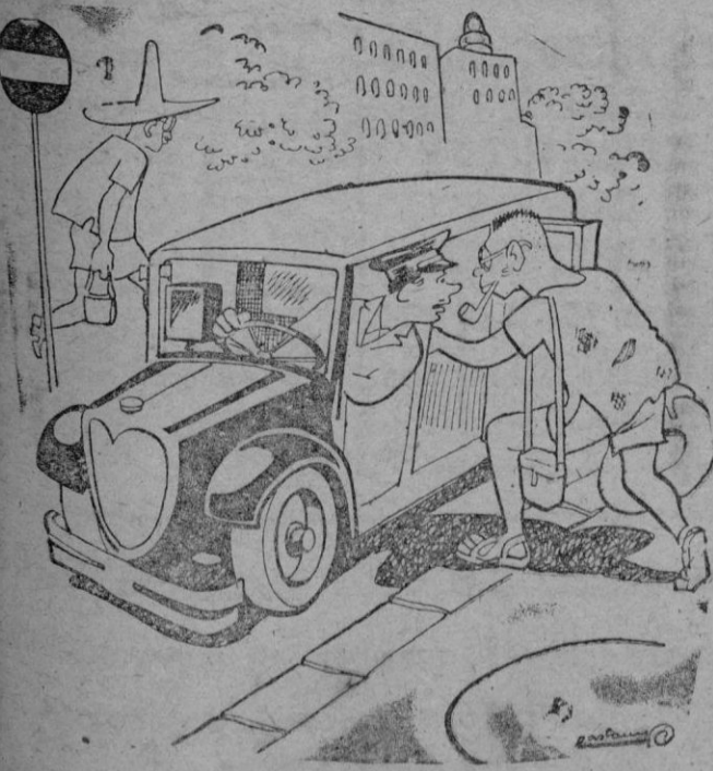
También estaría acertado crear el uniforme para los viajeros.