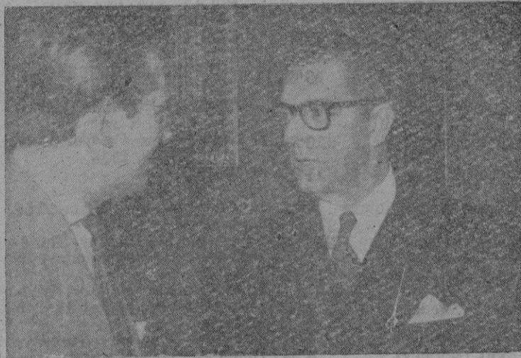
El Agregado Cultural del Consulado de los EE UU, en Barcelona, conversando con nuestro Redactor

—¿Qué faceta del Arte ejerce mayor atracción para el norteamericano?