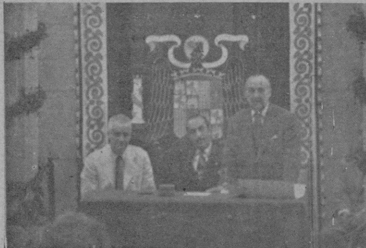
La presidencia del acto celebrado ayer en el Sanatorio de Caubet, integrada por el Gobernador Civil y los Doctores Rotger y Porcel