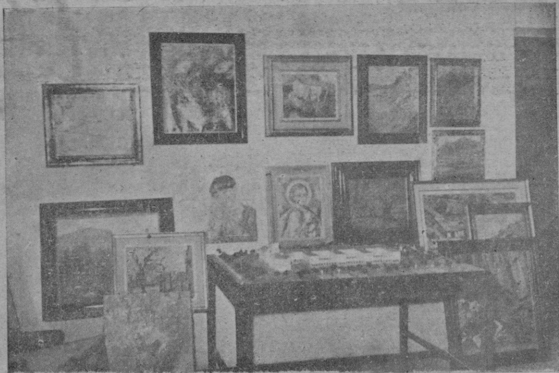
Junto a la maqueta del Nuevo Seminario — que aparece en la mesa central — obras de Anglada, Ochoa, Cittadini, Bañó, Cerdà, Maciejowski y otros artistas esperan la hora de ser expuestas en el Círculo de Bellas Artes como ofrenda de los pintores isleños a las obras del nuevo centro de formación de los futuros sacerdotes.