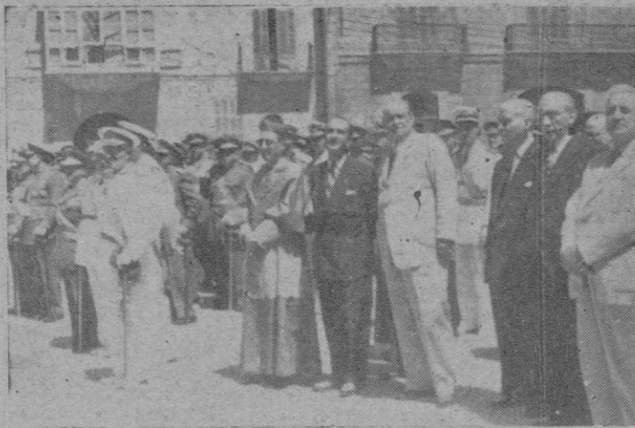
Las autoridades, después de asistir a la misa ofrecida por el Cuerpo de Sanidad a su Patrona en la Basílica de San Francisco, presenciaron el desfile de las fuerzas