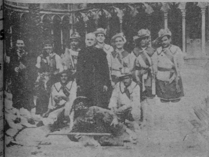
La agrupación folklórica "Cossiers de Manacor"