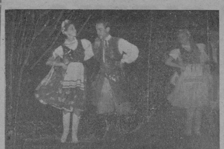
Una exhibición de las danzas del grupo de Polonia