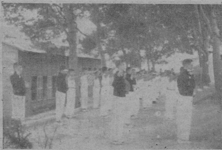
El grupo de Flechas Navales efectuando ejercicios de esgrima con ocasión de la clausura del curso