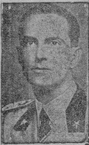
El Rey Humberto de Italia

Han sido excluidos de la herencia en virtud de una ley ratificada después por la Constitución republicana, el ex rey