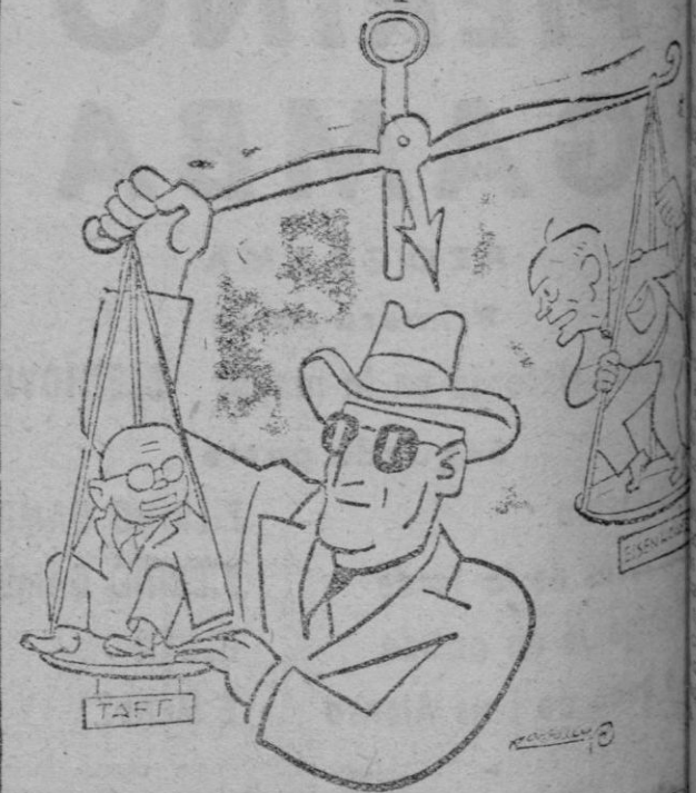
Mac Arthur: —A ver si inclino un poco la balanza.