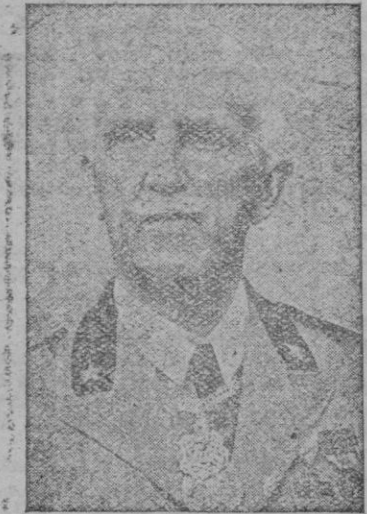
El Rey Víctor Manuel III de Italia

Es, pues, muy verosímil que en toda la Europa dominada