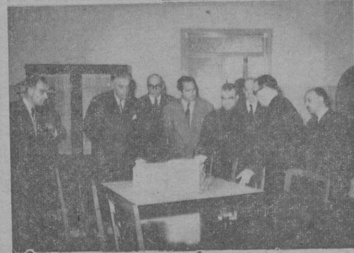
En la foto superior el Presidente señor Canals explica a los reunidos el desarrollo de la entidad. — En la inferior, el Director de "Mare Nostrum" enseña a los visitantes la maqueta del nuevo edificio.

ha de ser también el espíritu de entusiasmo y de superación que nos mueve lo que ha de valorar una labor tan ardua y complicada como la nuestra por estar medida en la misma médula de la vida moderna.