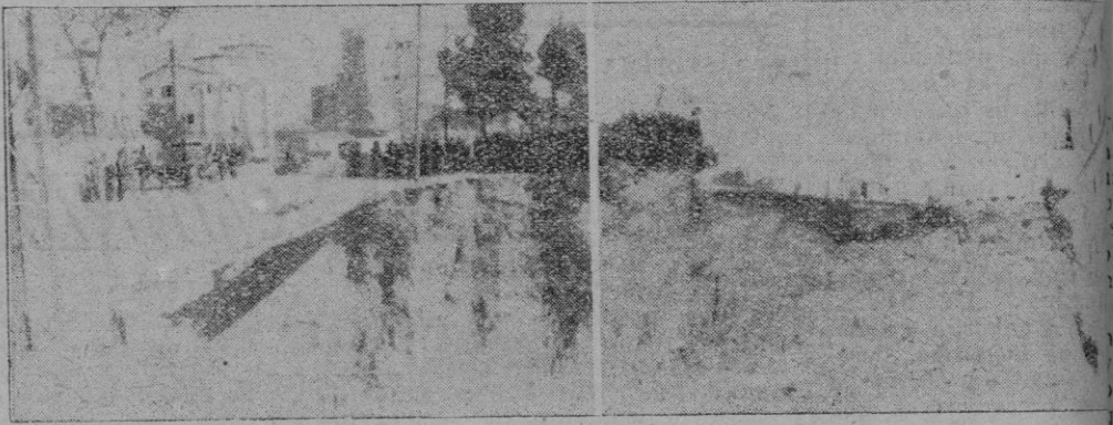
Dos aspectos del derrumbamiento de tierra ocurrido en "Es salt d'es ca"