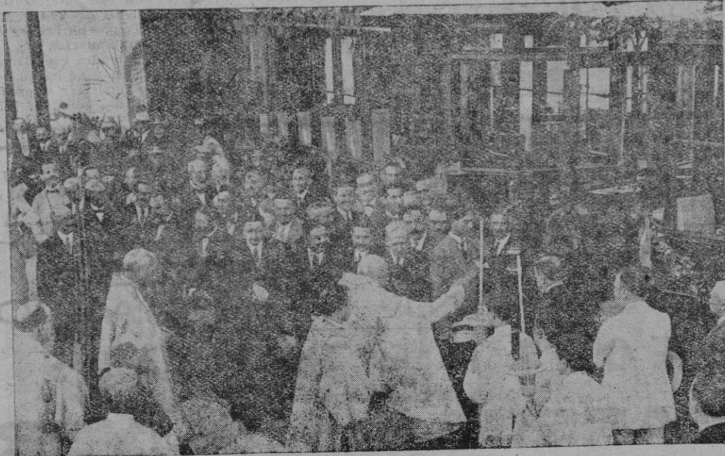
Foto retrospectiva que muestra el interés que despertó en Palma la bendición de los dos primeros tranvías eléctricos de la Compañía y que todavía prestan excelente servicio.