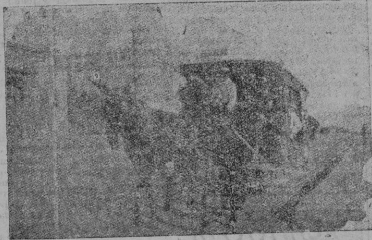
Uno de los viejos tranvías de matas, que gracias a la excelente reparación en ellos realizados, es posible que vuelvan a circular el próximo verano en algunas líneas como remolques.

realizando un repaso general en el material móvil, reparación de motores y en una palabra, se trató de poner en servicio la mayoría de los coches de que se disponía en el Parque de Material.