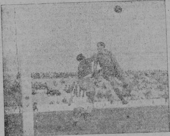
Una de las muchas intervenciones acertadas que prodigó el guardameta cordobés. En ésta, evita que Sans remate.

A los 38 y 39 minutos fueron casi bien un saque de esquina, que re-