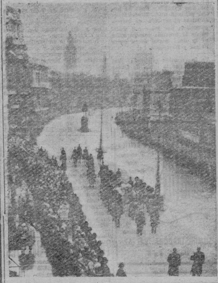
La llegada a Londres de los restos mortales del rey Jorge VI. El cortejo pasando por Whitehall, camino de Westminster