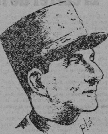
El general De Lattre de Tassigny

El general francés seguro de la victoria. Gracias a este gesto de valor y el avance del primer cuerpo de ejército al otro lado del Rin, hasta Innsbruck en el corazón de Austria, las fuerzas francesas figuraron entre las vencedoras de la pasada guerra. En Berlín, el general De Lattre asistió a la firma del armisticio.