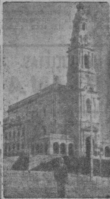
El santuario de Fátima