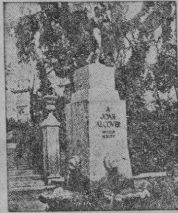
Monumento a Juan Alcover en el Jardín de la Glorieta