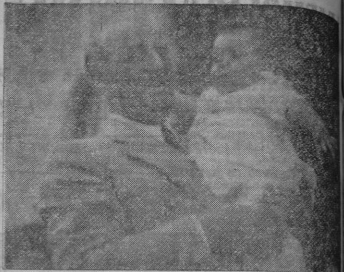
S. E. el Jefe del Estado con su nieto

Esta es la obra ingente del Caudillo de cara al mundo, fructíferamente entrecruzada con la de reconstrucción nacional, el prestigioso diario italiano "Il Tempo" —ha tenido razón y las mismas naciones que habían protegido al llamado Gobierno exilado abandonan ahora a este a su destino. El pueblo español es quien ha creado a Franco y los opositores, de todas las tendencias circulan libremente por España y gozan del derecho de crítica.