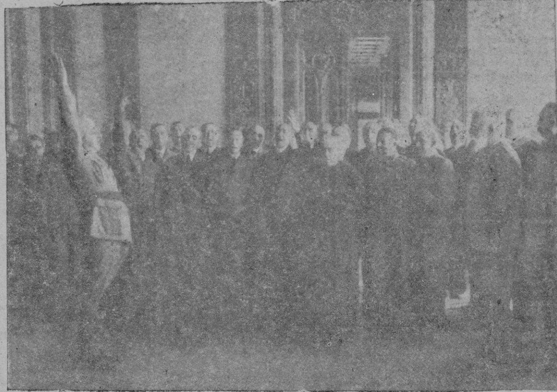
El 1.º de Octubre de 1936 en la Capitanía General de Burgo s. — Franco es elevado a la Jefatura del Estado español.

Gracias, en parte, a la benévola neutralidad española fue fácil a los aliados el desembarco en África del Norte que había de servir de base y catapulta para lanzar la decisiva y victoriosa ofensiva final contra Alemania.