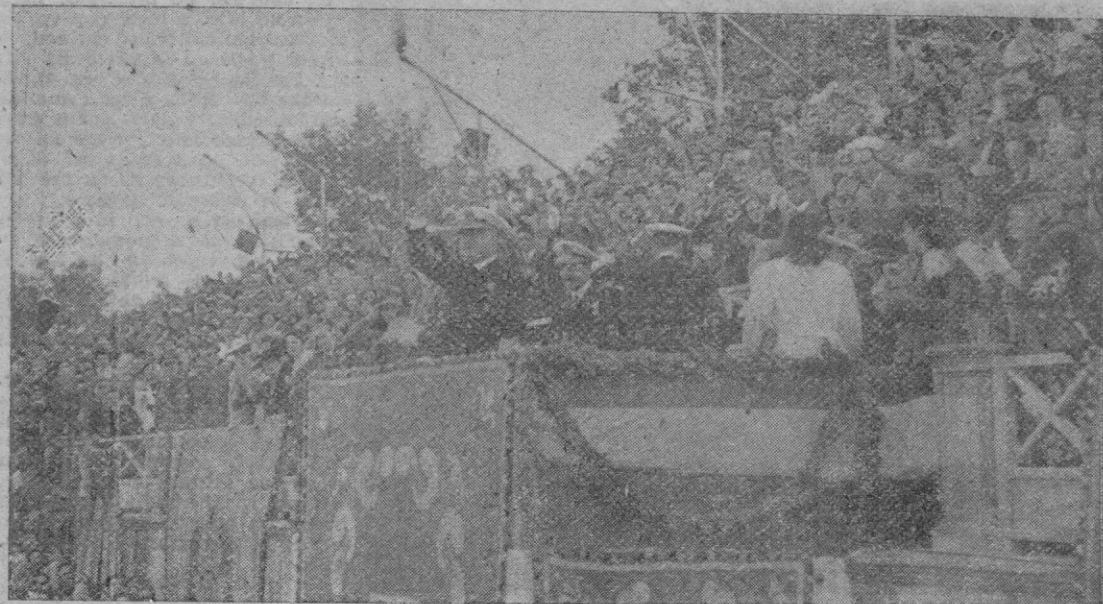
Estampa retrospectiva. Franco en su visita a Mallorca, es aclamado frenéticamente por el pueblo palmesano en el campo de la Hipica.

No es preciso añadir más testimonios, pero por fuerza debia ser así, para que fue el Movimiento Nacional iniciado e impulsado por Franco, una verdadera Cruzada, una cruzada de fe contra el comunismo internacional, contra los que querían raer de nuestra tierra el nombre de Dios y que ren todavía hacer lo mismo en el mundo.