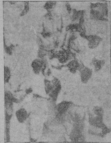
Un incidente durante los disturbios de Singapur, ocasionados por la decisión de un tribunal, separando a la niña holandesa de su madre adoptiva musulmana

"Me parece que fui solo en mantenerme hostil al invasor. Estaba seguro de que los japoneses serían derrotados a lo sumo en un periodo de tres