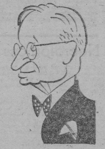
EL PRESIDENTE TRUMAN

SAN FRANCISCO, 4. (Efe). — En la ceremonia de inauguración de la Conferencia del tratado de paz con el Japón, el Presidente Truman ha pronunciado el siguiente discurso: "Me complace el darles la bienvenida a esta reunión convocada para la firma del tratado de paz con el Japón.