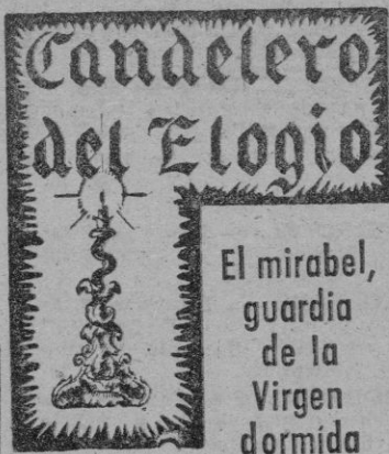
El mirabel, guardia de la Virgen dormida

Es un descuido imperdonable que cedamos el campo al enjambre curioso de los turistas, y los indígenas desertores de nuestro pueblo, mientras ellos, con su exótica indumentaria, con gesto indiferente y no pocas veces, con inaudita