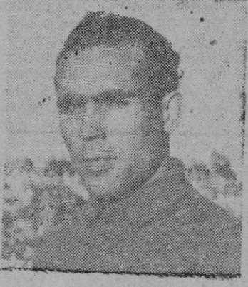
Bannasar defenderá esta tarde el marco del Manacor

El trió de ayer 6-8-1 se pagó a 410 pesetas por dos pesetas.