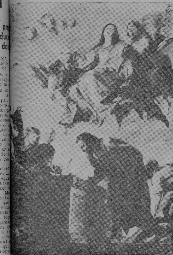
Magnífico cuadro de Cerezo, cuya fantasía refleja el misterio hoy ya dogma de fe