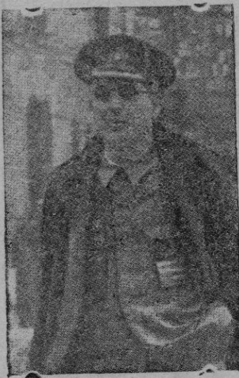
EL MINISTRO DE INDUSTRIA Y COMERCIO

VALENCIA, 14. (Cifra) — El primer buque transbordador de la Marina Mercante española, denominado "Cinco de Agosto" en conmemoración de la gloriosa fecha del cruce del Estrecho durante la guerra de Liberación, ha sido botado hoy al