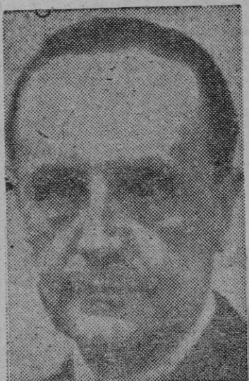
EL MINISTRO DE JUSTICIA

Se concedió la palabra a D. Gustavo Navarro y Alonso de Celada, quien defendió el dic-