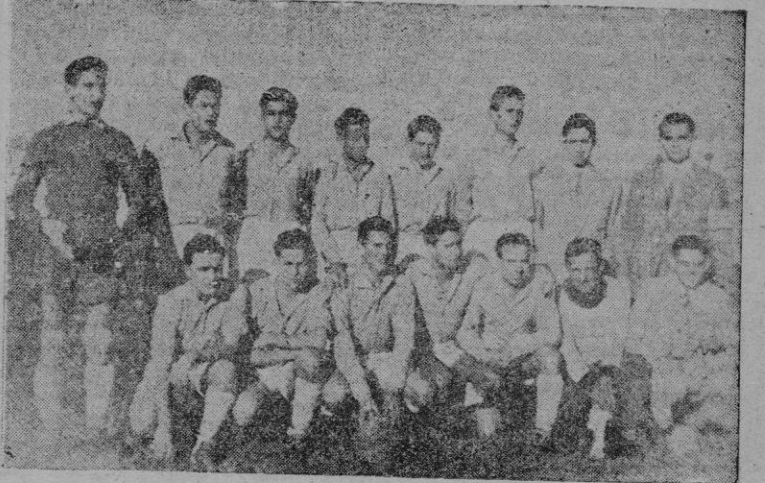
El conjunto de San Felipe, que después de una magnífica campaña, ha conquistado el Título de Campeón del Grupo Palma A, sin ningún resultado en contra.

ante el Ferrolense ha conseguido el primer puesto — a pesar de faltarle un encuentro — del Grupo Palma B. sin conocer el amargor de la derrota. Ha sido la campaña del nuevo campeón magnífica bajo todos los aspectos. El San Felipe, cuyo foto nos complacemos en consignar, ha recibido muchas felicitaciones a la que nos-