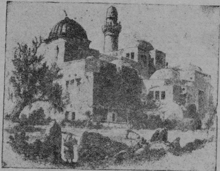
Vista exterior del Cenáculo (Grabado antiguo)

Gloria de Mallorca es Doña Sancha, piadosa bienhechora de los Santos Lugares, digna hija de Doña Esclaramunda de Moncada, hija de los Condes de Fox — los más ricos de Languedoc — una de las mujeres más acabadas de su tiempo, esposa de nuestro D. Jaime II.