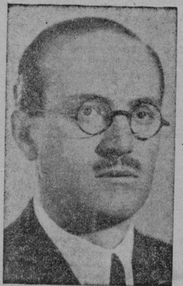
El Ministro de E. Nacional

MADRID, 30. (Cifra). — Esta mañana han comenzado las deliberaciones de la XI reunión plenaria del Consejo Superior de Investigaciones Científicas.