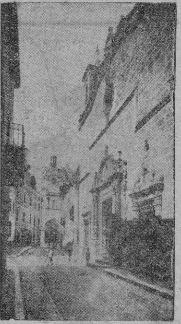
Una estampa típica ciudadela. Calle e iglesia del Rosario.

Ciudadela. — Tal como anunciábamos la pasada semana, llegaron el sábado a Ciudadela las huellas que acatilla Ricardo Gascón para rodar exteriores en nuestra ciudad. La noticia de su arribada cuajó rápidamente en todos los ámbitos y pronto se vieron rodeados los cineastas de enorme cantidad de aficionados,