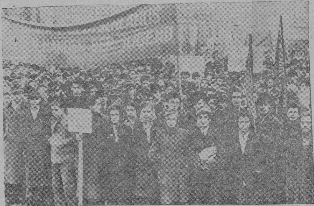
En la zona rusa de Alemania, los comunistas organizan manifestaciones juveniles, pidiendo que se les haga extensivo el derecho de votar. Reproducimos el aspecto de una de esas manifestaciones, celebrada en Potsdam. Más de 3.000 jóvenes recorrieron las calles principales de la ciudad. Los comunistas no desaprovechan la menor oportunidad para explotar el hambre de las masas juveniles para sus fines políticos.