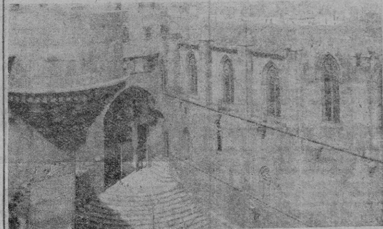
Barcelona. -- La Plaza del Rey

Los domingos por la mañana va bastante gente al Polo, pudiéndose ver Misa a pleno sol en la capilla de dicha aristocrática Sociedad, presenciando