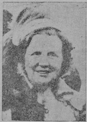
La Reina Juliana de Holanda

que se ha celebrado en su honor y en el del príncipe consorte, en el palacio de Buckingham. "Europa —agregó— tiene