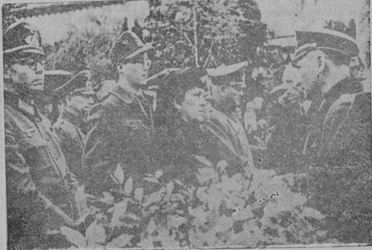
El hijo de Rommel y su viuda en los funerales

Según Strolin, Von Rundstedt "conocía lo ocurrido o lo sospechaba, y odiaba el papel