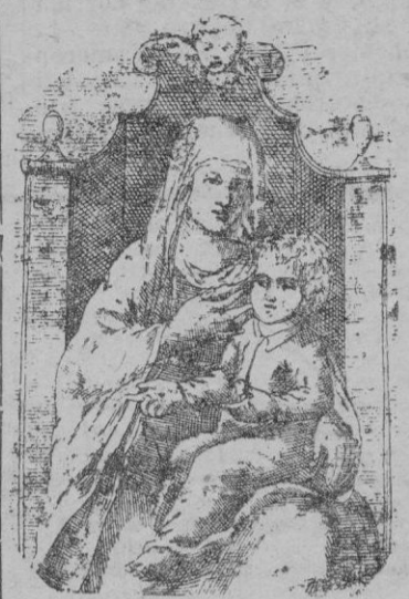
Effigie de Santa María "del Pianto"

mezalbetes salieron a jugar en la calle bajo la figura de la Virgen María, y con el ardor del juego disputaron. Dios sabe por qué, hasta el punto que vinieron a las manos, en forma tal que uno, derribando al otro, estaba ya a punto de atravesarlo con su daga. Preso éste de horror mortal imploró la vida en gracia de la Virgen Santísima a cuya vista se desarrollaba la pelea. Al nombre