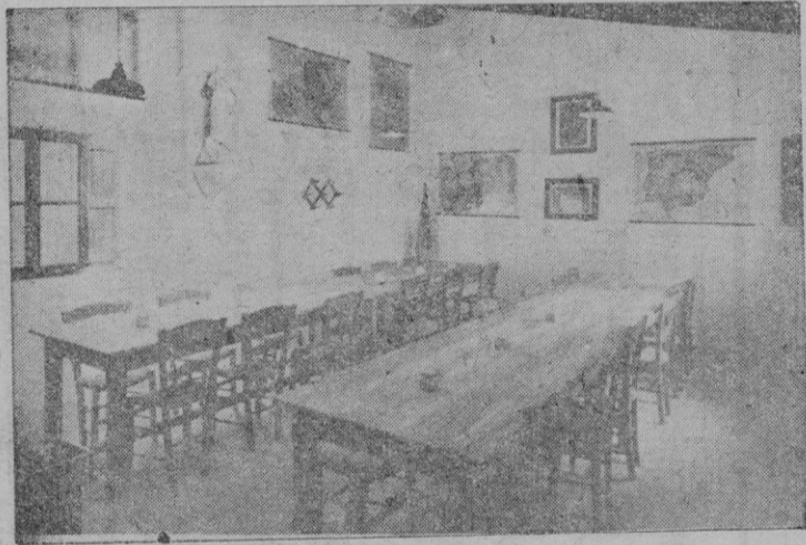
El aula escolar

Que el Señor y la Virgen Santísima y S. Felipe Neri se lo paguen y a nosotros nos ayuden en la consecución de nuestro fin: "A Dios por la Música".