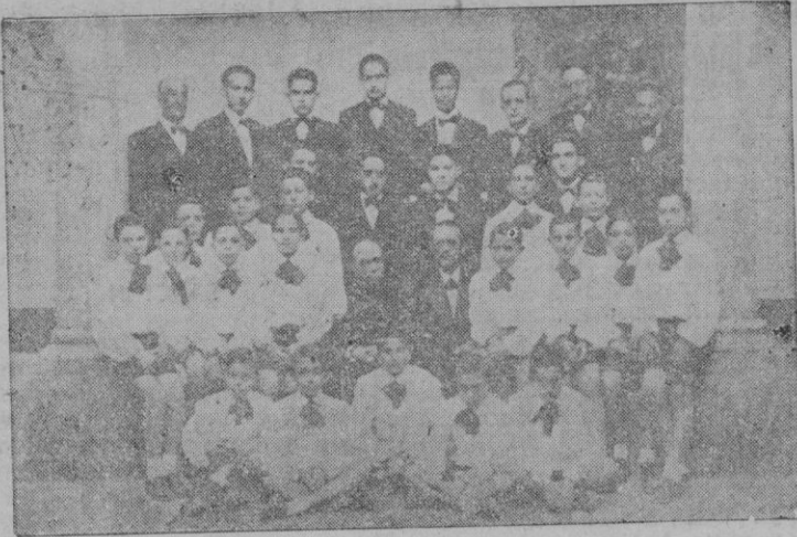
La «Capella Oratoriana»

Necesitamos una sala de juegos con mesas de ping-pong, ajedrez, damas, parchesi, etc., y una biblioteca infantil. Y nuestro archi