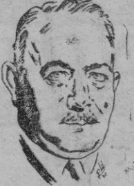
Von Neurath, antiguo Ministro de Asuntos Exteriores de Alemania, a quien varios intervienen con Strolin junto a Rommel.