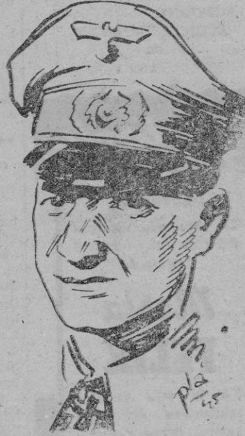
El general Speidel

COMO el General Speidel tenía que ser en la vida futura de Rommel — en rigor lo estaba siendo ya — algo más que un simple jefe de Estado Mayor, es un personaje que evidentemente requiere especial atención. Físicamente, se parecía de un modo extraordinario a Sir James Grigg, el por entonces Secretario de Estado británico para cuestiones relativas a la guerra. Tenía la misma expresión de aguilá, igual nariz, un cerebro tan claro y exacto como el suyo (todavía lo tiene) y un temperamento filosófico quizás todavía más acusado, dato éste casi lógico si se tiene en cuenta que era un sujeto verdaderamente original; un soldado profesional que es a la vez un filósofo profesional. A los diez y siete años se enroló en el ejército. Esto ocurrió el año 1914. Después de pasar la guerra en el frente occidental y parte de ella en la misma brigada de Rommel, decidió seguir en la milicia entre guerra y guerra e ingresó para ello en una Academia. Al mismo tiempo estudió filosofía e historia en la Universidad de Tubingen, graduándose como doctor en Filosofía "Summa cum laude" en Febrero de 1925. Si esta doble carrera no es un caso único, puede muy bien ser calificado de original.