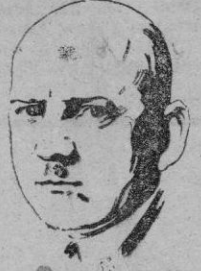
El general Todt

Su propio Cuartel General — que había trasladado a La Roche Guyon, al noroeste de Paris, — lo frecuentaba casi exclusivamente de noche. El magnífico