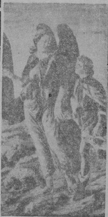
Muy oportunamente el Cuerpo de Mutilados de Guerra eligió al Arcángel San Rafael para Patrono suyo.

EL ARCANGEL SAN RAFAEL Patrón del Cuerpo de Mutilados de Guerra