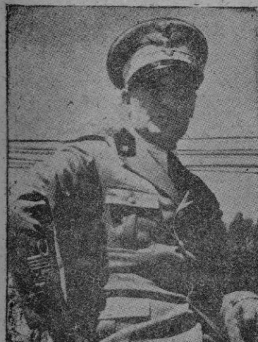
EL MARISCAL GRAZIANI

ROMA, 2. (Efe). — Se sabe que esta noche, los cinco generales que forman el tribunal que juzga al Mariscal Graziani emitirán su sentencia.