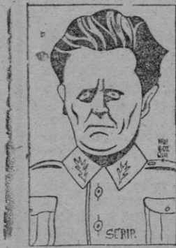
El Mariscal Tito

El 23 de abril se inicia una conferencia de los representantes de los tres Estados.