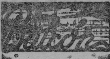
Calle del Sindicato

No llovía ya, ayer tarde. Pero la calle del Sindicato, convertida en una serie de lagunillas sin posible desembocadura, conservaba inequívocas muestras de la abundancia con que esa agua de Abril, que se dice tan valiosa, había caído.