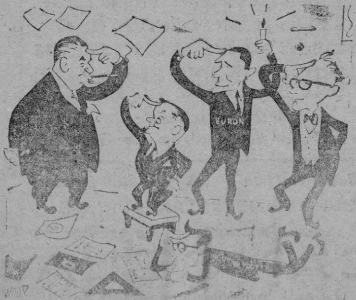
—¡Una idea! ¿Y si aume ntásemos los impuestos? (De "L'Aurore", de París)