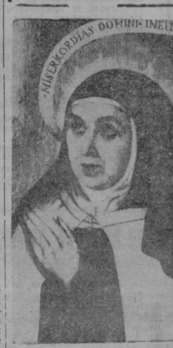
MISERICORDIAS DOMINI INE

Los periodistas de España no nos hemos contentado con el patronazgo de San Francisco de Sales, sino que como españoles hemos querido otro patronazgo celestial y ningún otro santo nos pareció más adecuado que la mística Doctora, la Santa de Avila.