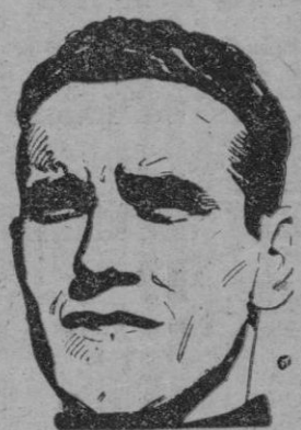
Elzaquirre, el formidable guardameta del equipo nacional español, que jugará el día 28 en Es Fortí.

Las gestiones que el Mallorca realizaba para conseguir que fuera un gran equipo el que visitara Es Fortí, el próximo día 28 de los corrientes, para jugar un partido amistoso que sirva de presentación del once titular mallorquinista, han dado el mejor de los resultados.