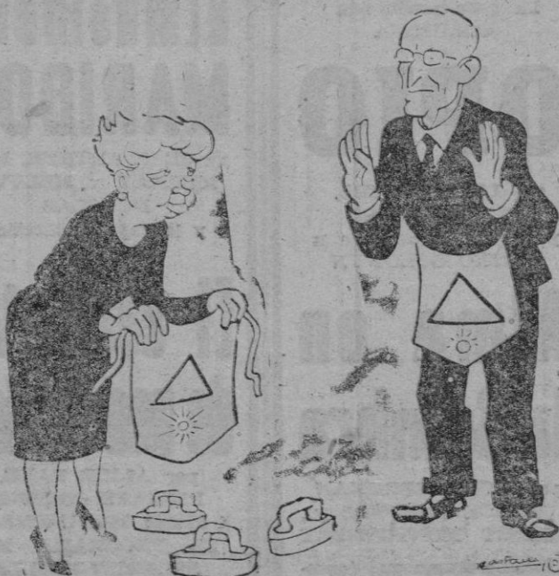
—Le ofrezco mi dimisión. —De ninguna manera. Usted seguirá perteneciendo al servicio de planchas.

LEA NUESTRA SECCION DE ANUNCIOS POR PALABRAS