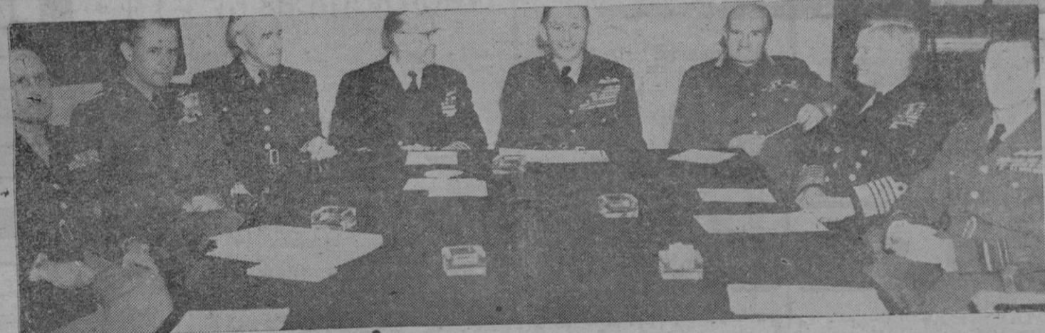
La foto nos presenta reunidos en torno a la clásica mesa redonda, donde se fraguan o se previenen las guerras a los siguientes personajes por este orden de izquierda a derecha: Gruenther, general Vandenberg, general Bradley, almirante Duffield, lord Tedder, vicealmirante Slim, almirante Fraser y mariscal del aire Elliot.