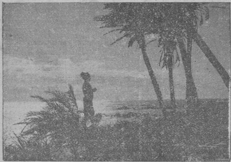
Costa de la Somalia, colonia italiana hasta la última guerra mundial.

imperialistas, llaves de roles estratégicas. Eran tierras de trabajo. No eran tampoco depósitos de riqueza virgen robados a sus propietarios legítimos, sustraídos a la ingenuidad de los nativos inermes. En nuestras colonias no florecía el árbol de caucho, que diera a Italia un monopolio, no había allí minas de oro que nos permitieran obtener la autonomía de la moneda; no había yacimientos diamantíferos, ni carbón con el que Italia hubiera podido liberarse de los precios que le imponen las grandes potencias carboníferas; ni siquiera petróleo que liberase a Italia de las horcas caudinas de la importación.