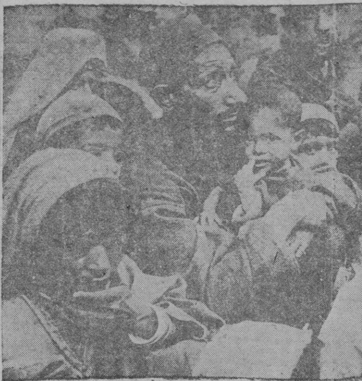
Esta dramática escena sobre los sufrimientos del pueblo de Cachemira, fué obtenida a raíz de la última disputa entre la India y el Pakistán. Se trata de refugiados que regresan nuevamente a sus hogares, toda vez que la paz parece asegurada, ya que ambos Dominios han aceptado la celebración de un plebiscito que decidirá cuál será el futuro del país.